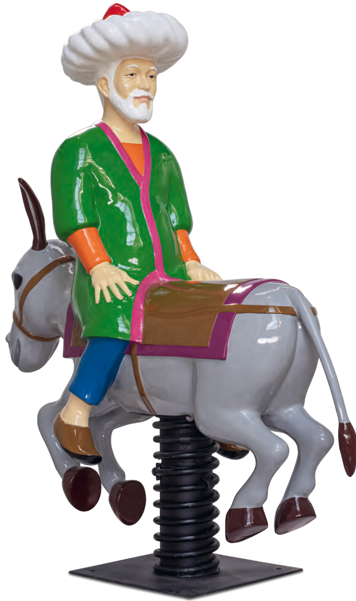
Slavs and Tatars, Molla Nasreddin the antimodern , 2012