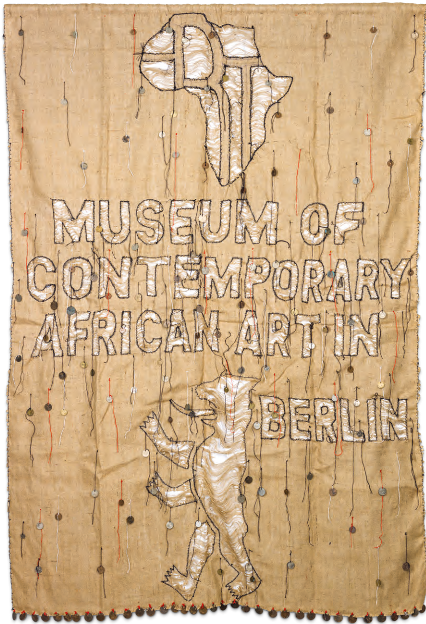
Meschac Gaba, Museum of Contemporary African Art in Berlin , 2014