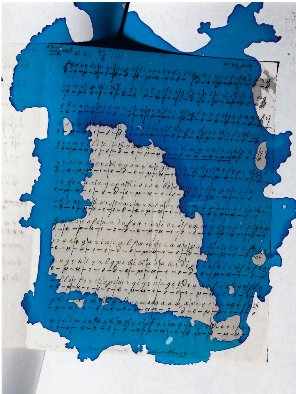
Viviane Sassen, Code / Blue , 2019 Aus der Serie / From the series Venus & Mercury