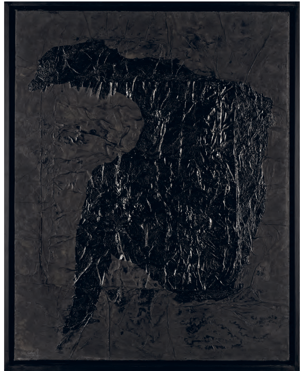
Yang Jiechang, 100 Layers of Ink , 1992–1994

Auch in den 2012 entstandenen Collagen der rumäniendeutschen Literaturnobelpreisträgerin Herta Müller (*1953) fungieren