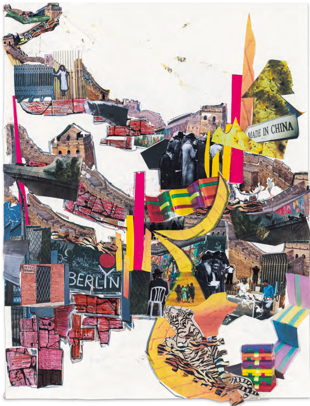
Agathe Snow, Walls , 2010