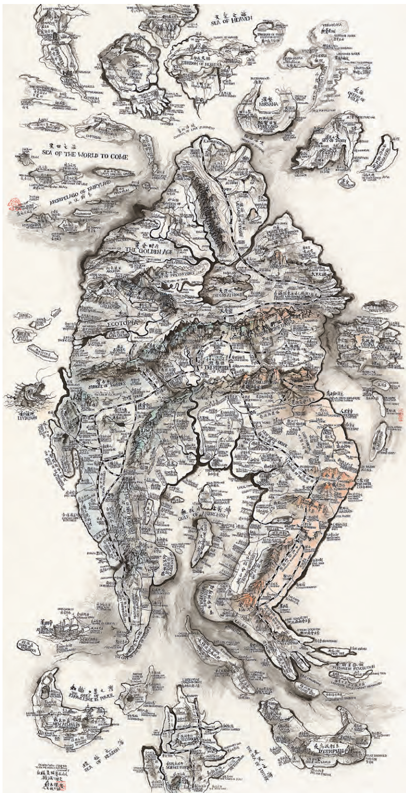
Qiu Zhijie, Map of Utopia – People Claimed to Be Messiah Crowding History , 2015 Aus der Serie / From the series 24 World Maps , 2015–2017

to religion, philosophy, and literature in a world of international cross-fertilization—that appeal to me as a collector and, based on experience, also to viewers of the works in the Written Art Collection.